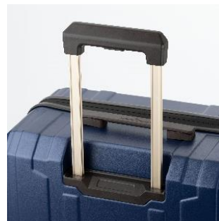
多段階キャリーバー