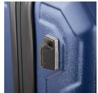
フック機能付き台座 (M/L)