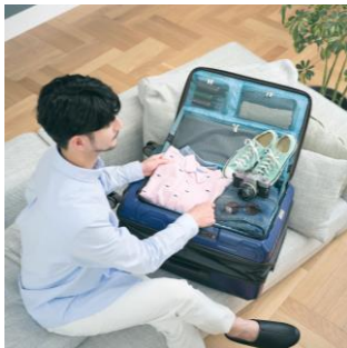
フロントオープン

狭い場所でもスムーズに荷物の出し入れができるフロントオープンタイプで、拡張ファスナーの操作により奥行きが約7cmアップ（収納量最大30%アップ）する拡張機能「POWERFUL-EXTENSION」を搭載したハードケース。拡張部には衝撃に強い独自構造と、撥水仕様の生地・ファスナーを採用しているため、突然の雨でも、中の荷物を濡らさずに守ることが出来ます。その他、持ち手の高さを1.5cm刻みで調整できる多段階キャリーバーや、ちょっとした荷物をかけられるフック機能付き台座など、T&Sならではの機能性が満載の製品です。