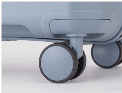
ダブルキャスター

ボディ同色で持ちやすく3段階に高さ調節可能なキャリーバー。小さな荷物(2kgまで)を吊り下げられるフック付き台座を採用。