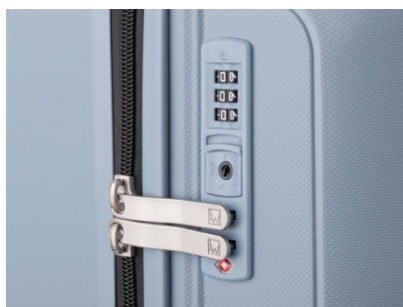
TS ロック (ダイヤル式)

ボディ素材は、軽量 PP (ポリプロピレン) を使用。世界標準の TS ロックを搭載。カラーは、6 色(ラップブラック、アッシュグレー、スチームホワイト、サンドイエロー、ミストグリーン、スモーキーブルー)。