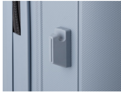
フック付き台座 (49 サイズ未搭載)

ボディ同色で持ちやすく3段階に高さ調節可能なキャリーバー。小さな荷物(2kgまで)を吊り下げられるフック付き台座を採用。