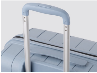
3段階キャリーバー