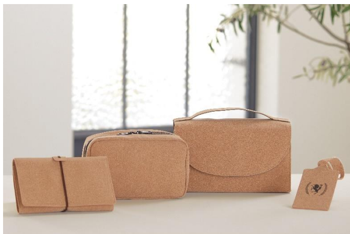
左から、トラベルオーガナイザー、テックポーチ、トイレタリーポーチ、ラゲッジタグ

“旅をもっと身近に。”を企業理念に掲げ、スーツケースをはじめとした旅用品を企画・販売する総合メーカー、株式会社ティーアンドエス（本社：埼玉県越谷市、代表取締役：齊 真希、以下T&S）は、あらゆる旅のシーンで使用できるデザイン・品質・機能にこだわったトラベルブランド『LEGEND WALKER（レジェンドウォーカー）』より、コルク素材を使ったサステナブルな旅専用小物シリーズ『tabitabi（タビタビ）』を新発売します。トラベルオーガナイザー、テックポーチ、トイレタリーポーチ、ラゲッジタグの4種類のラインナップで、2月29日よりオンラインストア（ LEGEND WALKERストア ）ならびに全国の取り扱い店舗にて順次販売開始します。